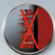
Ouverture individuelle et totale des tiroirs

Dimensions : L 1060 x l 470 x H 1030 mm Dimensions utiles des tiroirs : L 925 x P 390 x H 110 mm Dimensions des tiroirs : L 565 ou 295 x P 390 x H 55 mm Charge maxi par tiroir : 45 kg Charge maxi : 850 kg Poids : 125 kg